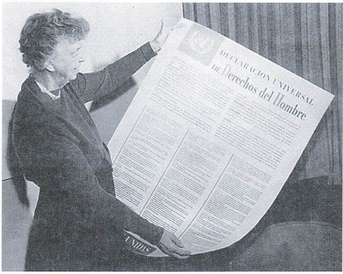
Déclaration universelle des droits de l'homme, articles I, IX, XII, 10 décembre 1948.

«Tous (être) ..... sont ..... égaux devant la loi et (avoir) ..... ont ..... droit sans distinction à une égale protection de la loi. Tous (avoir) ..... ont ..... droit à une protection égale contre toute discrimination qui violerait la présente Déclaration et contre toute provocation à une telle discrimination.»